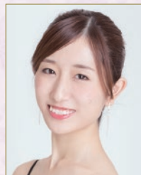
渡辺 麻友 フリー